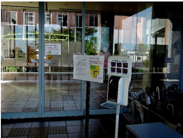
② 主出入口の手指消毒器と入館時案内